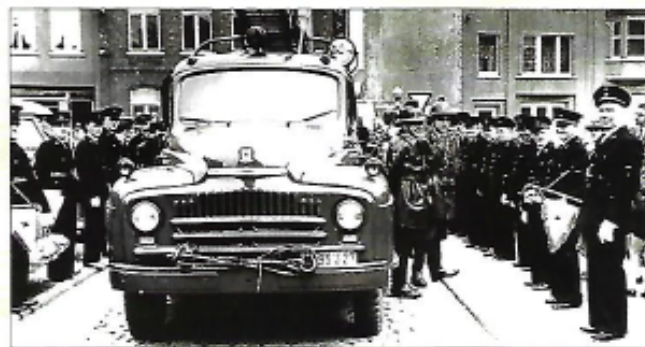
Op de foto ziet u hier op Bissegemplaats ter gelegenheid van de overhandiging van een nieuwe brandweervagen 'de Dodge'.