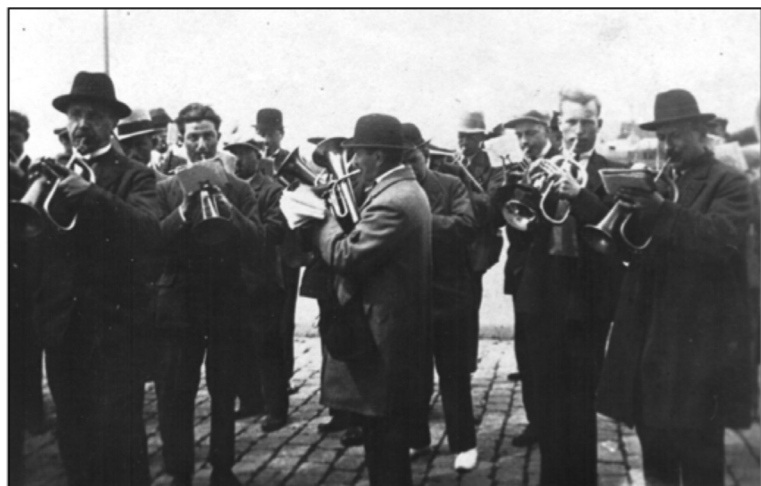
Zo werd De Leiegalm in 1932 uitgenodigd op een festival in De Haan.