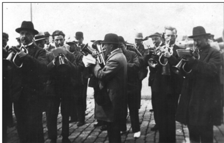
Zo werd De Leiegalm in 1932 uitgenodigd op een festival in De Haan.