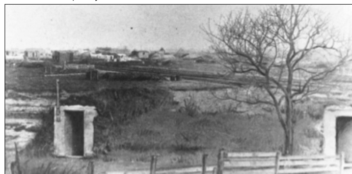
Duits munitiedepot tijdens WO1

Wist je dat Bissegem tijdens de terugtocht van de Duitsers volledig geëvacueerd werd? Iedereen kreeg het bevel te vertrekken. Intussen vernietigden de Duitsers de elektriciteitsvoorzieningen, de brug over de Leie, meubelen en schooluitrusting. Glasnegatieven van foto's waarop meisjes te zien waren in de armen van Duitse officieren gooiden ze aan scherven. ●